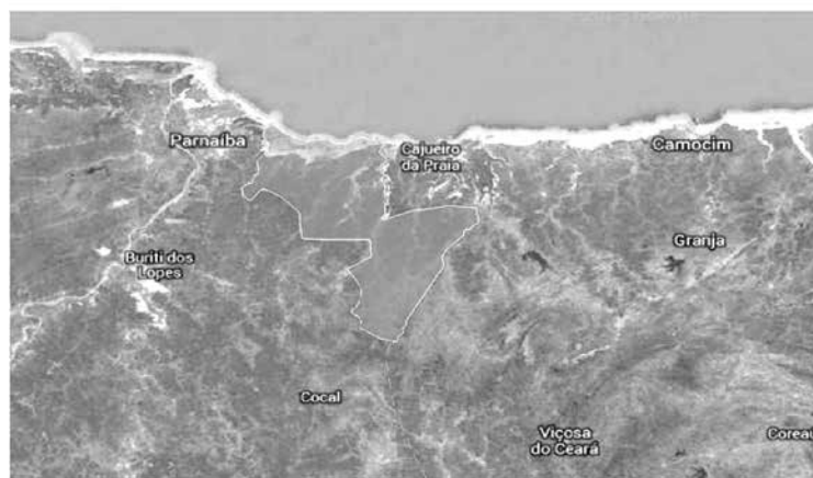
Figura 1: Mapa de Luís Correia Google MapLink e IBGE - Dados cartográficos 2013

Luís Correia está inserida na região de abrangência de Parnaíba, principal cidade do Norte do Estado, com influências econômicas significativas. É parte integrante da região do Baixo-Parnaíba e do Tabuleiro Litorâneo. Compõe também, como cidade de interesse turístico da Rota das Emoções, que reúne cidades do Norte do Piauí, do Noroeste do Ceará e Nordeste do Maranhão.